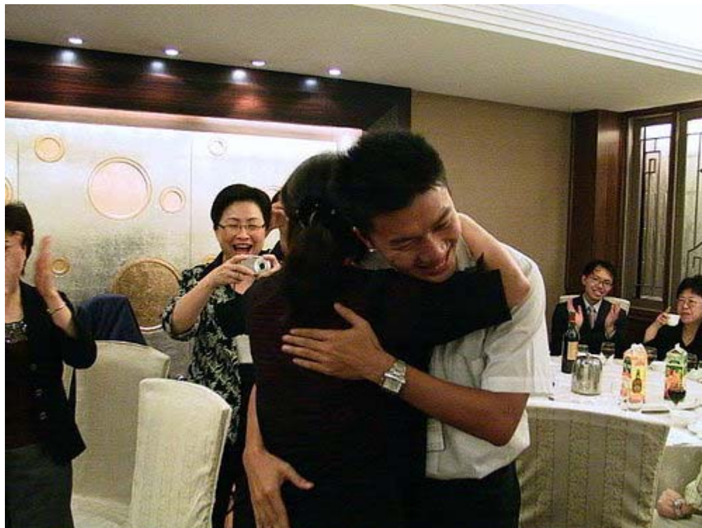
下圖：學員長與僑委會代表臨別祝福一抱

下圖：適逢紐約代表的五十大壽，我們特別派出年輕的越南代表獻出他又深情又誠摯的「清純一抱」；不明就理者還會以為是失散多年的母子相見呢！