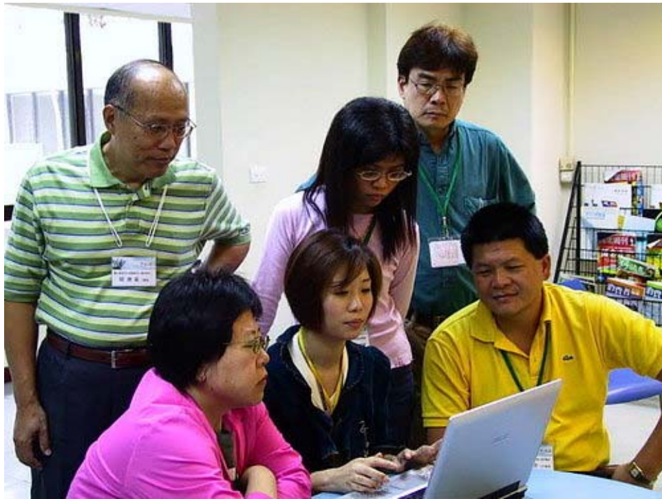
以下三圖：各數位中心展開企劃書撰寫大作戰