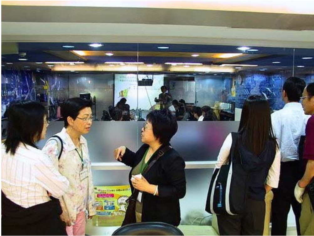
下圖：巨匠電腦又開拓了巨匠美語