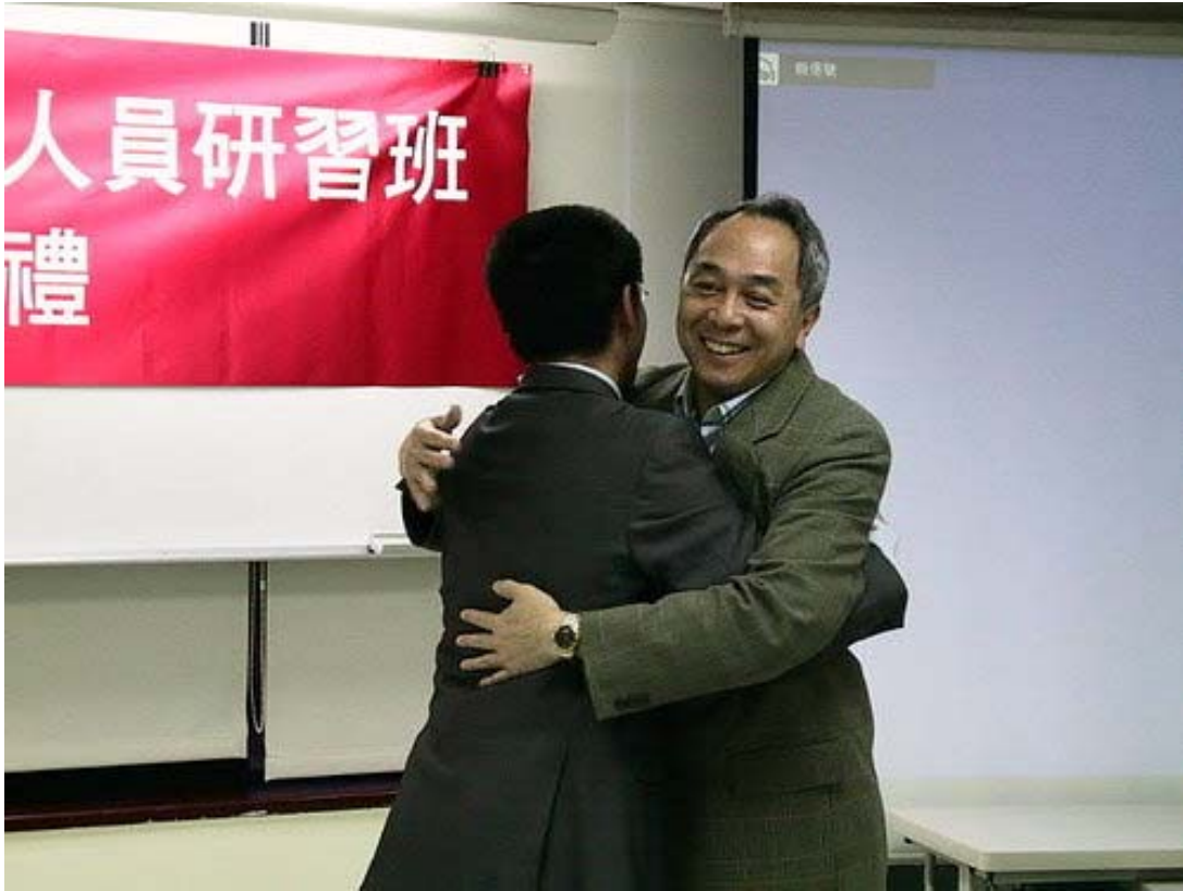
下圖：副學員長接受全體學員的感謝卡，以及華府代表的抱抱