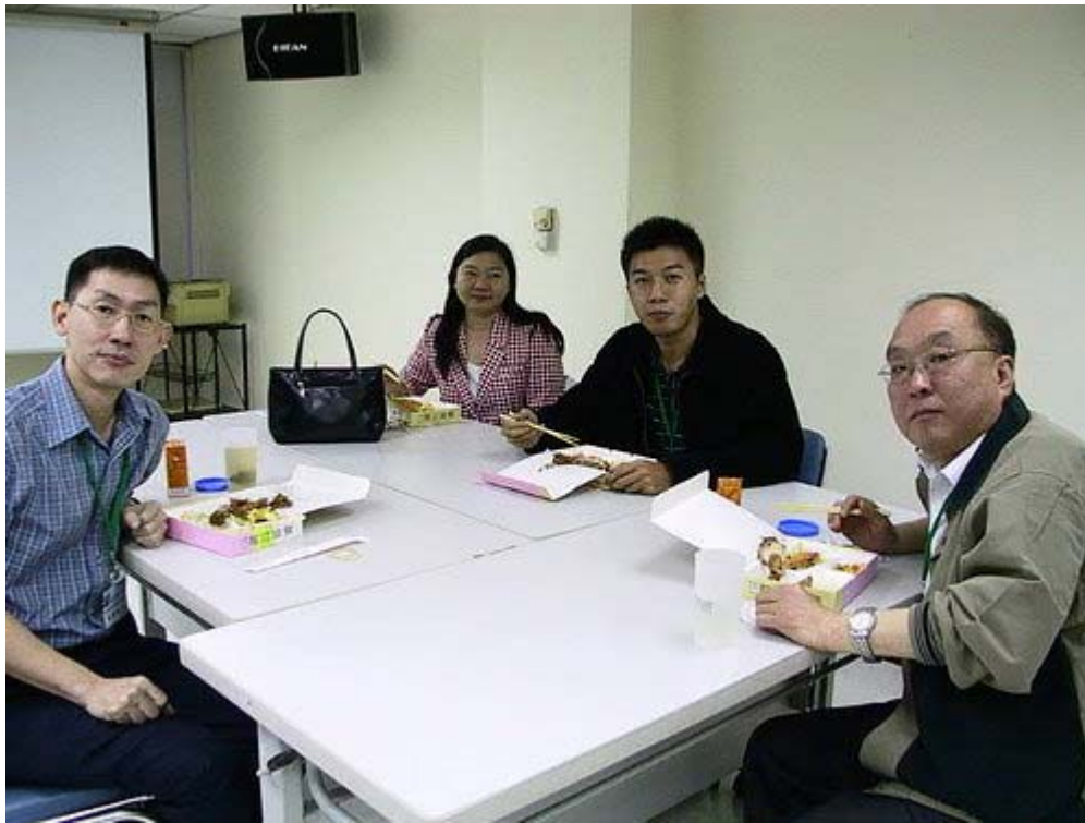
下圖：資策會人員向我們解說 GMHP 計劃