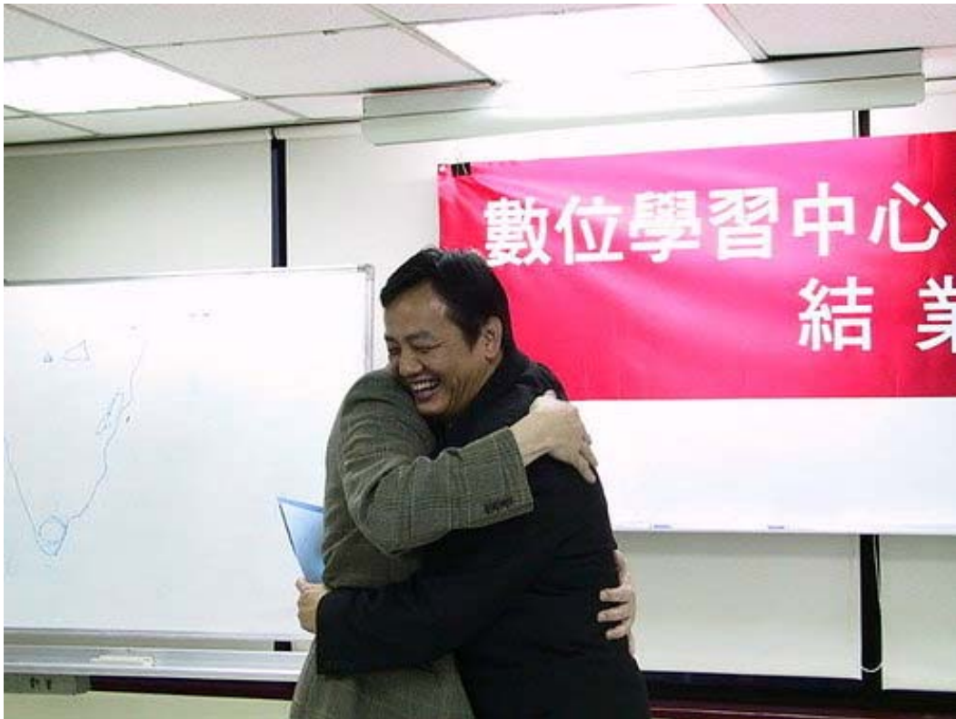
下圖：學員長接受全體學員的感謝卡，以及西雅圖代表的抱抱