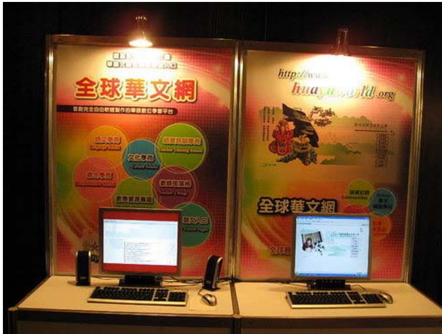
下圖：記者會現場介紹世界各地電腦中心的一景