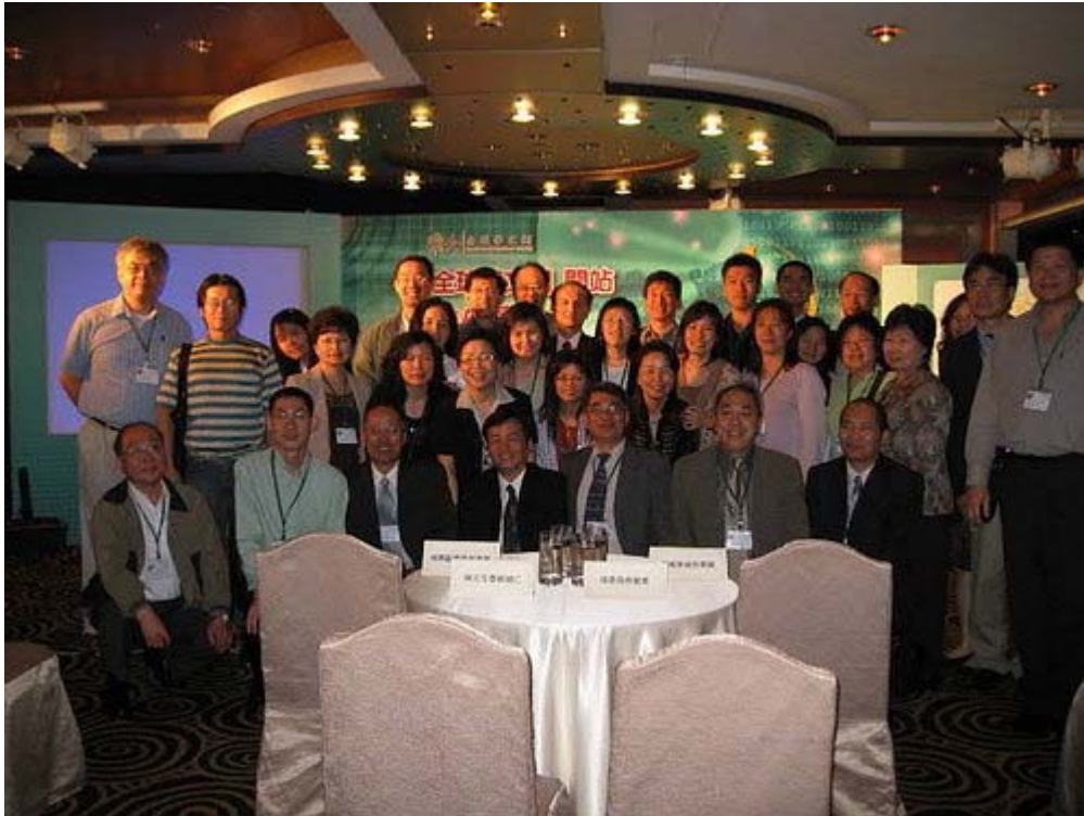
下圖：代表 13 個數位學習中心(電腦中心)的其中 5 人，被安排在最前排座位