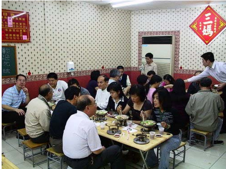
下圖：第一桌