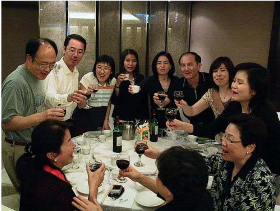
下圖：學員長與副學員長終於逮到機會，可以好好地喝上它幾杯了