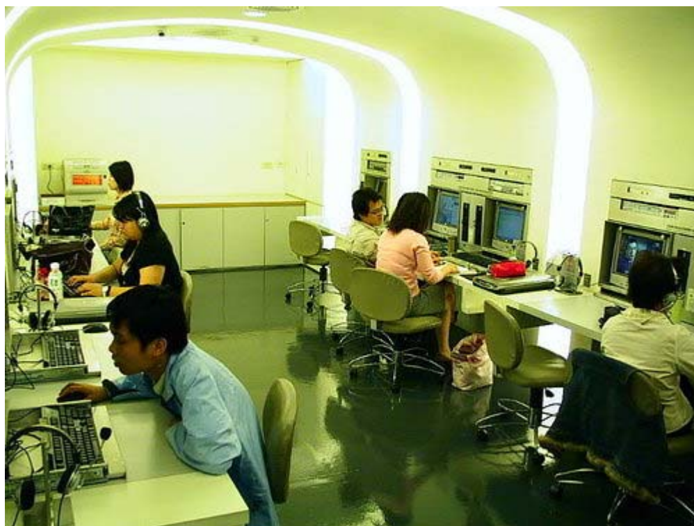
下圖：走廊明亮清潔，空間雖不大但一點兒也沒有擁擠的感覺