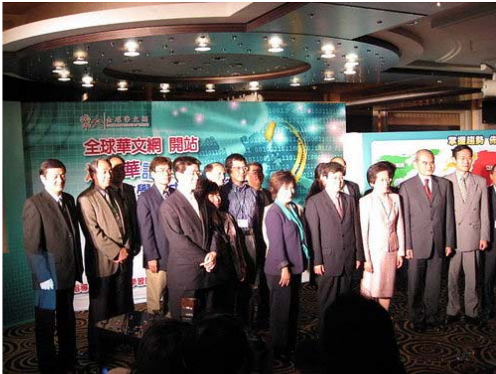
下圖：全球華文網開站儀式中介紹溫哥華