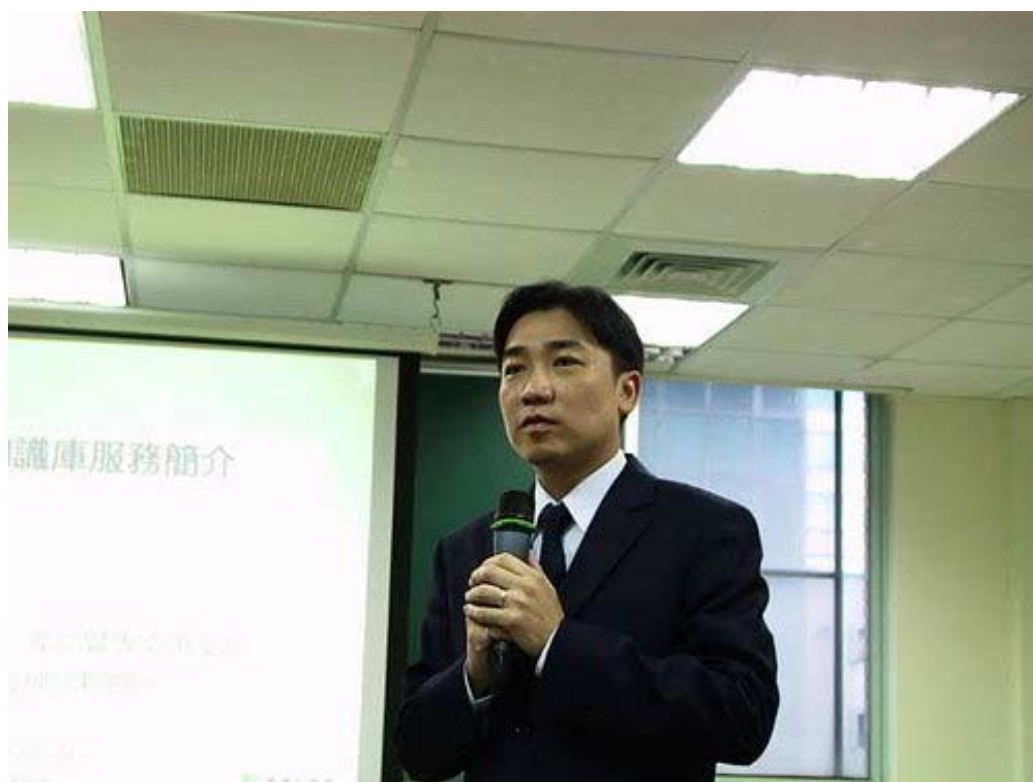
下圖：台灣知識庫的大教室