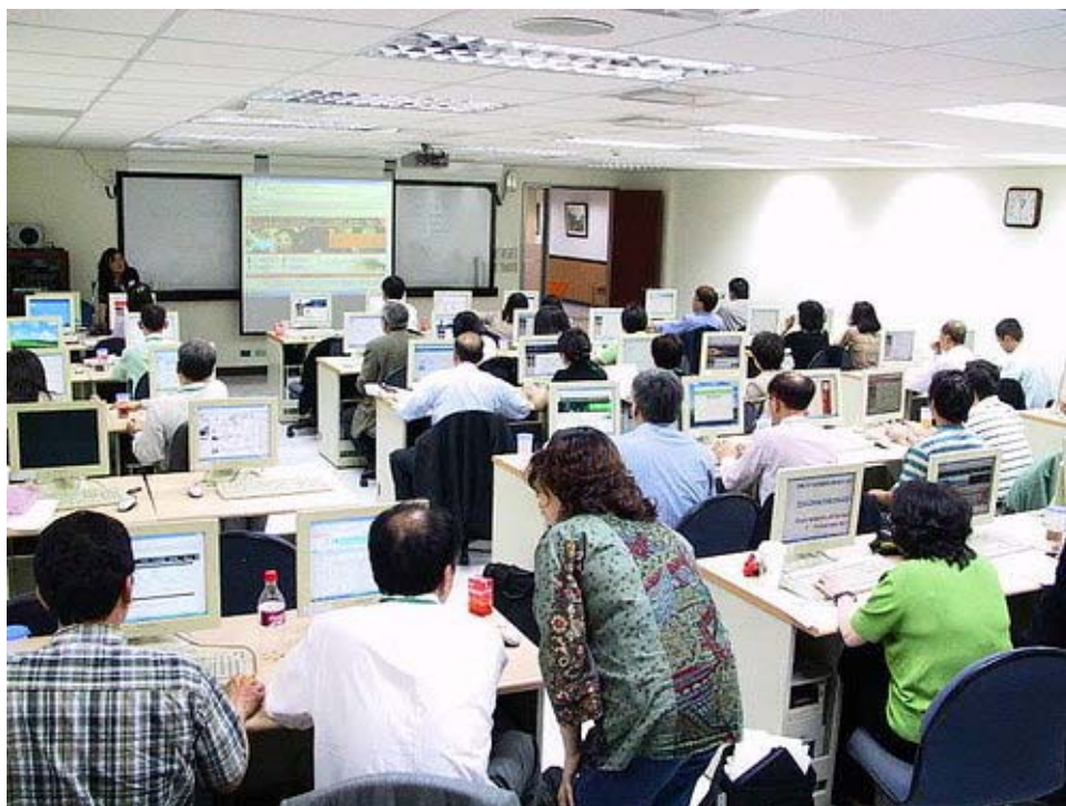
下圖：學員們體驗全球華文網的精采內容

「全球華文網」的網址： http://www.huayuworld.org ，朋友們有空一定要去逛逛，寶藏豐富必定讓你驚嘆！