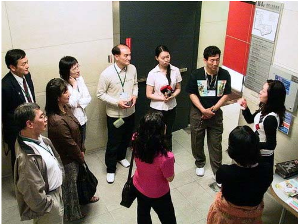
下圖：高度E化的圖書館

下圖：大樓中每一個樓層都有刷卡機，學生的個人卡片記錄了個人資料、校園資訊及 e-dollar，個人卡的背面便是公車悠遊卡