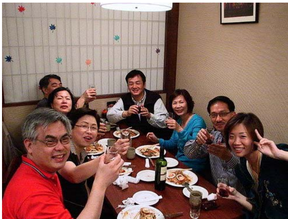
下圖：彼此互相敬酒，感情又顯得更加融洽了