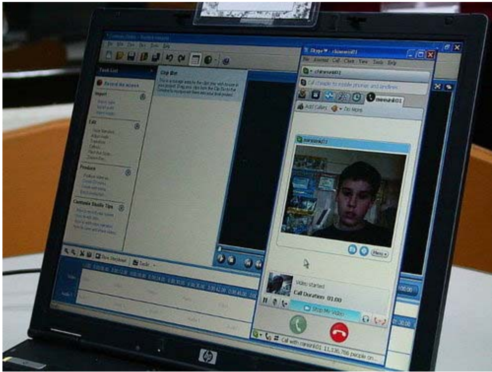
下圖：中文教師們在電腦中，個別向美國的小學生教授中文