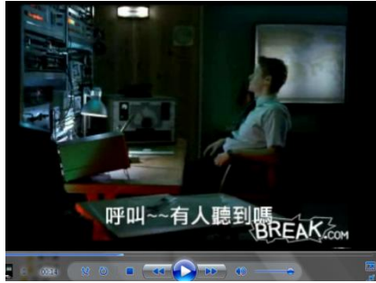
You Tube 影片