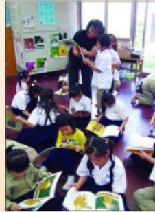
圖：南投縣國小師生共讀時間《我愛書》。