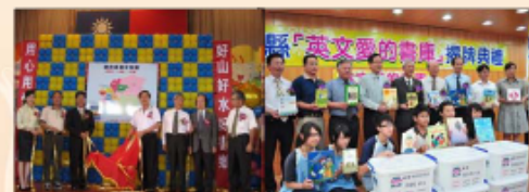
圖：南投縣率先完成一鄉鎮一書庫 圖：成立英文「愛的書庫」，提供多元優質好書。