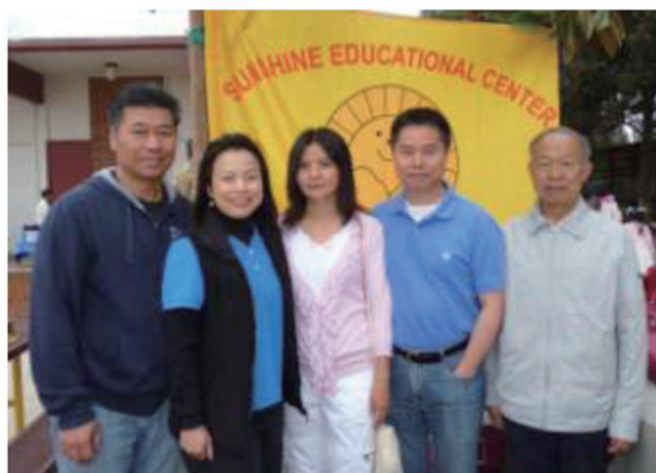
參加中文學校聯合會學術比賽的家長與主任合影