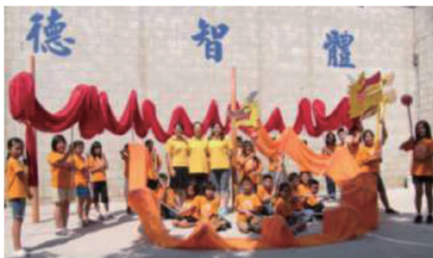
暑期中文班的師生組成祥龍獻瑞隊

地址：3107 N. Gladys Ave., Rosemead, CA 91770 電話：626.573.8485 網址： www.sunshineeducenter.com