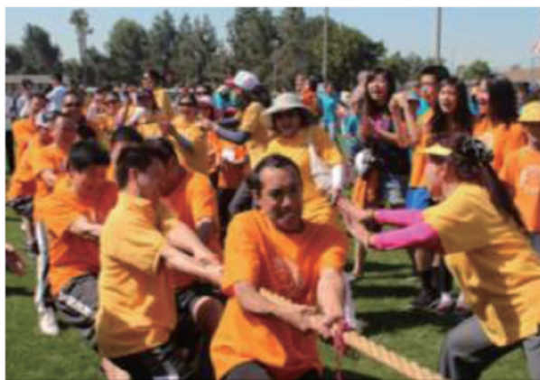
全體師生家長齊上陣在拔河比賽上大展身手