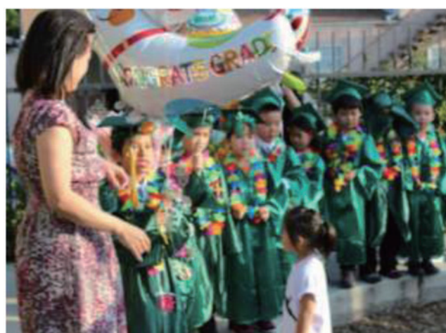
2013 年幼稚園小朋友畢業典禮盛況