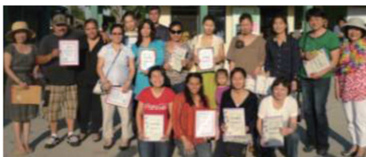
2013 年母親節隆重表彰積極參與學校活動的家長並與校長主任合影