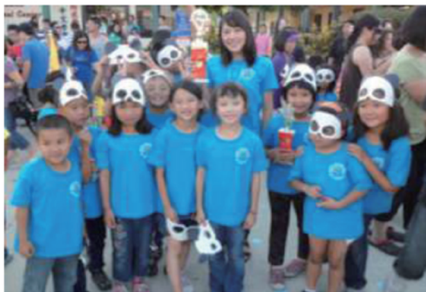
暑期教學成果競賽獲獎班級師生合影