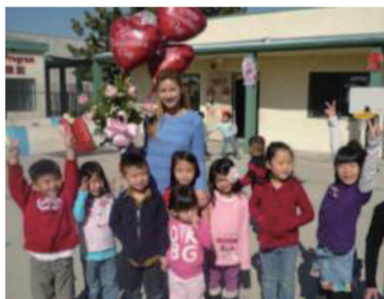
2013 年情人節小朋友為老師送上「愛」的禮物