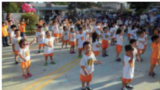
暑期教學成果展參加表演的幼稚園小朋友