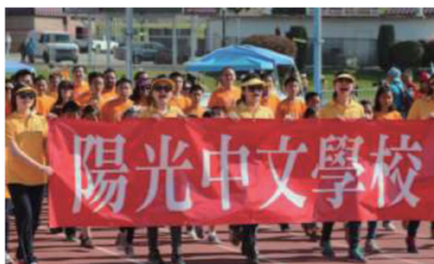
全校師生家長精神抖擻參與2013年南加海華運動會