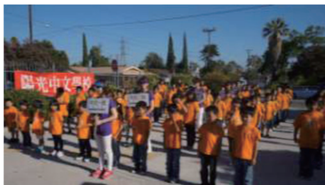
暑期教學成果展全體中文班師生列隊表演