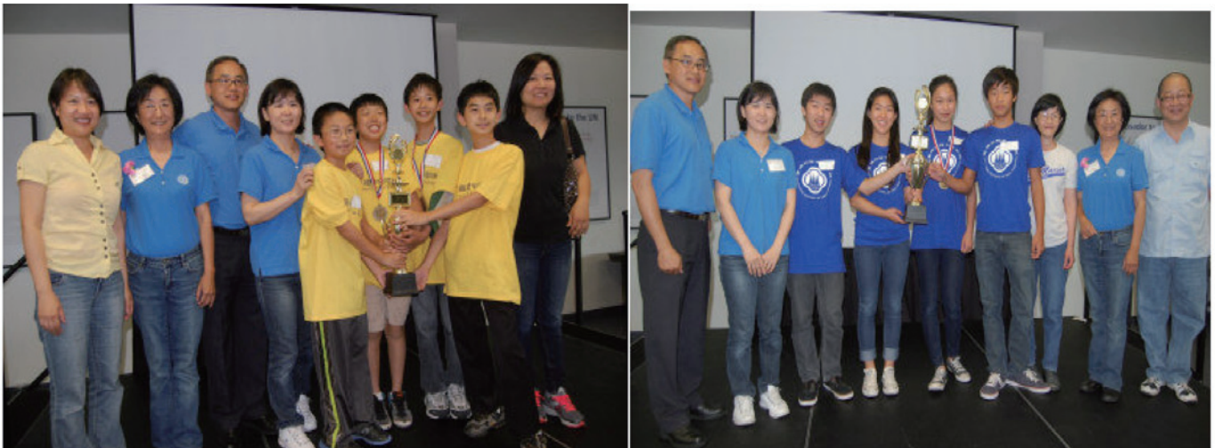
爾灣中文學校獲團體初級組冠軍(左圖),聖瑪利諾中文學校榮獲團體高級組冠軍(右圖)

南加州中文學校聯合會 2013 年中華歷史文化常識比賽，12 日（周日）下午 1 時起在查普曼大學舉行，今年有七所中文學校 100 多人參加，經過激烈賽事，爾灣中文學校一舉奪得團體初級與中級組冠軍，聖瑪利諾中文學校榮獲團體高級組冠軍，將參加 8 月於芝加哥舉行的全美總會比賽。該項比賽尚有喜瑞都、千橡、西區、核桃孔孟及哈岡中文學校參加。團體賽以四人為一組，有些學校派出不止一隊參加同一個級別的比賽，不乏「兄弟相爭」場面。有些隊因人數不夠，與其他中文學校併隊參加。