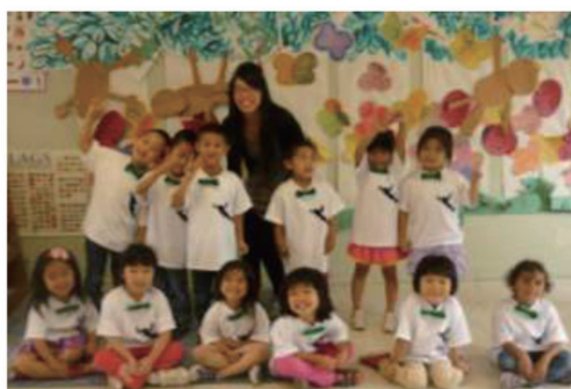
小朋友與老師一起親手裝飾服裝與教室牆壁