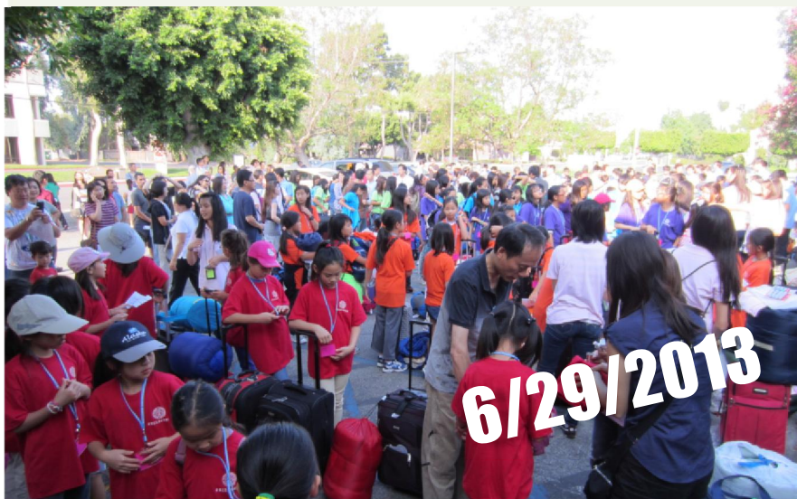
Farewell to the families at El Monte