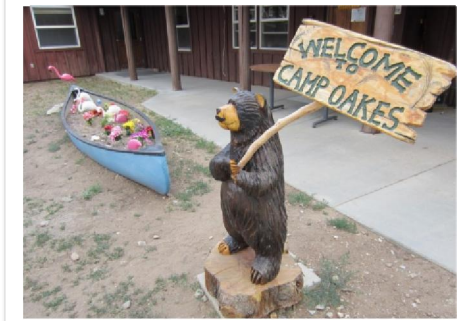
辦公室前門入口的小熊木雕像歡迎來客