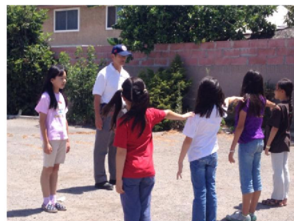
如何保持適當間隔