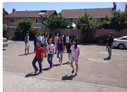
行進步伐要求一致