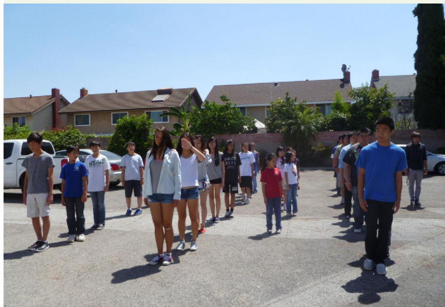
學員幹部在家烈日下接受嚴格的紀律訓練