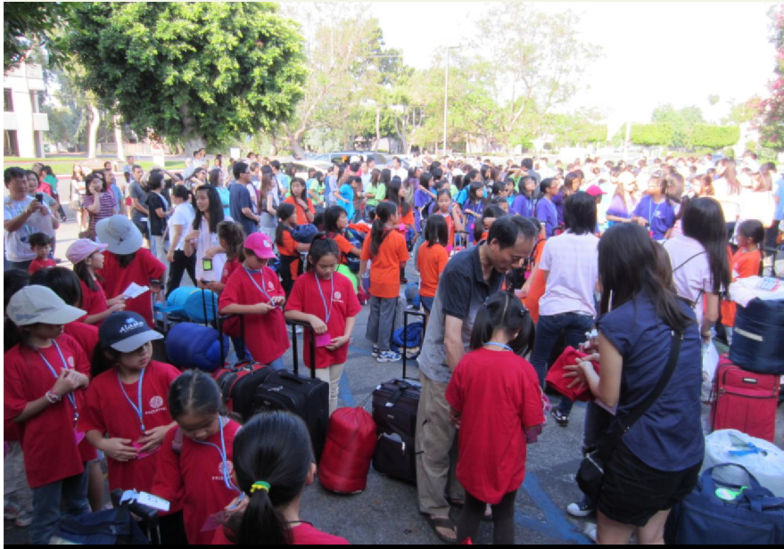
離別前最後的叮嚀與交待