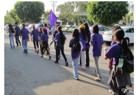
神采奕奕向未來一週的訓練營挑戰