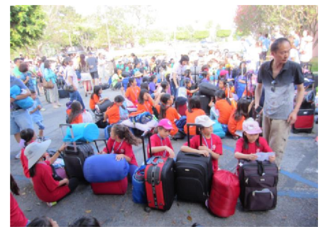
充滿興奮的期盼與等待