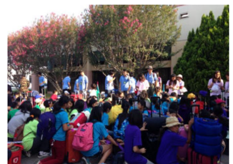
臨行前的交待與祝福