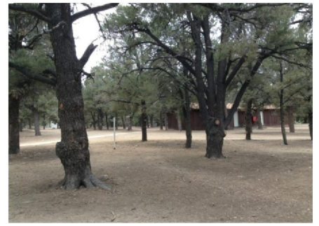
營地林木不多，但環境優雅怡人