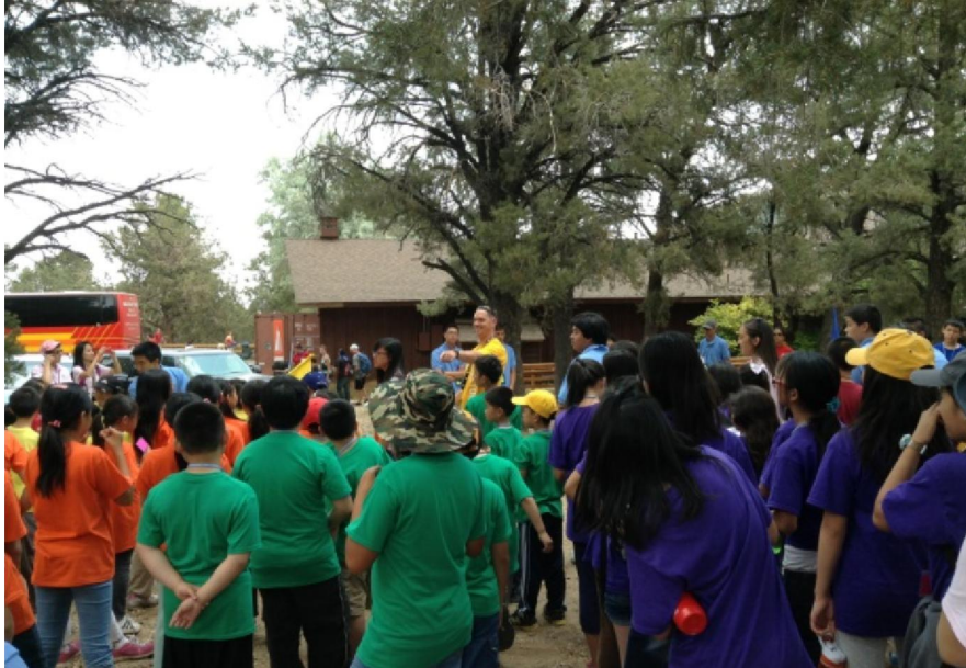
營地經理講解設施使用注意事項