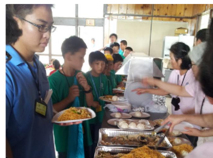
Late lunch on the first day