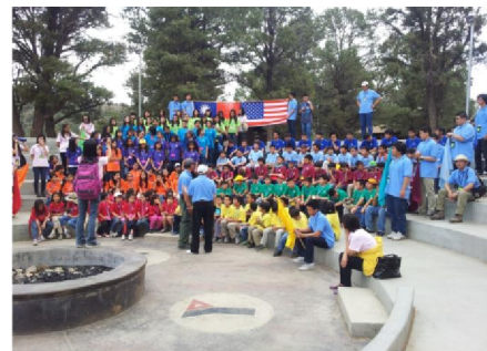
Group photo taken upon arrival